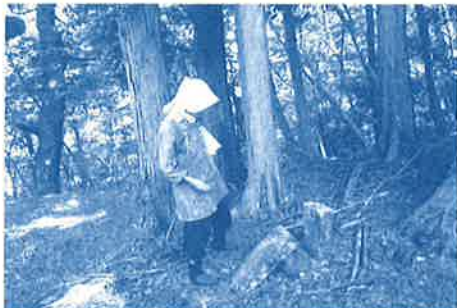
最初の峠まで地元の方がついてきてくれた

昭和三十三年にNHK長野放送局で放送された「五つの峠」では、当時の泰草村・枋城での教育と生活の様子が描かれています。これらの「五つの峠」を通る道は、大城峠・枋萩・門石峠・継石塔・相戸峠を通り、温田へ続く道と継石塔から匠平を通り大畑へと続く道があります。これらの山道は、車の通れる林道が開通するまで、枋城の小中学生、保健師さん、郵便配達の方などの行き交う生活道でした。今回の例会山行では、枋