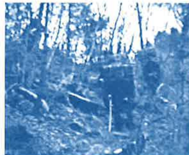
当時の枋城から温田への炭運びの様子

城の中学生たちが背負子で炭を温田へ運ぶときに使った山道を温田方面から枋城へと歩きました。