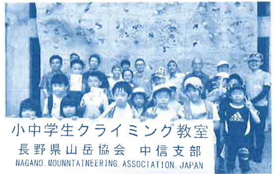
小中学生クライミング教室 長野県山岳協会 中信支部 NAGANO MOUNTAINEERING ASSOCIATION JAPAN

何度と同じルートをチャレンジする子どもさんたち、多くのポイントをゲットするために皆さん一生懸命。三時間があったという間でした。